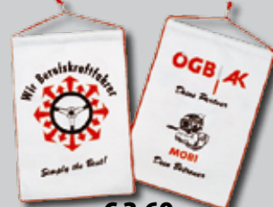
Wimpel (ohne Ständer)