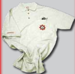
Polo-Shirt, L, XL, XXL